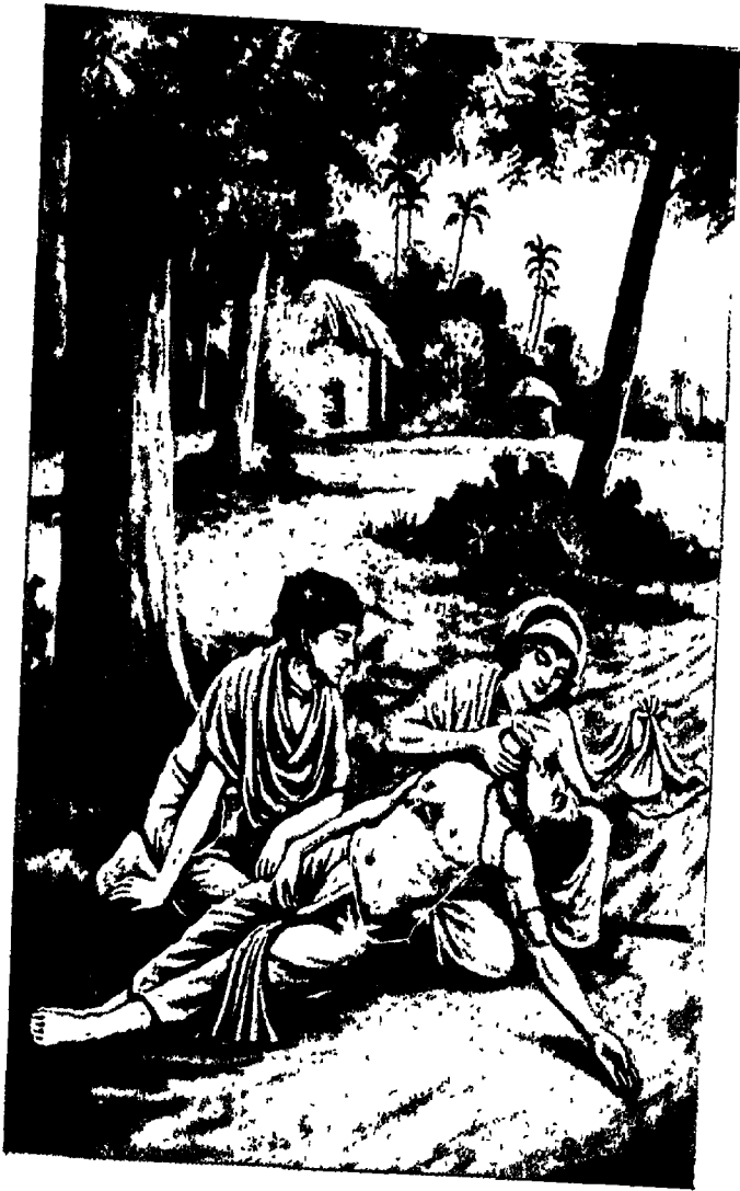
भक्त जयदेव, पराशर और भगवान्